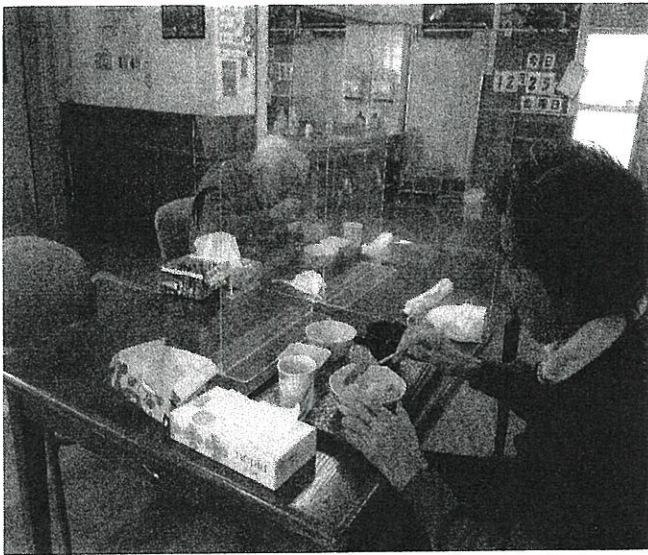
・食事では席をずらし亚克力板

先達での事業所内の感染に伴い、十分な感染予防が出来てなかった事への反省から、職員はもとより利用者含め消毒除菌・マスク・フェイスシールド・食事の際の亚克力板の設置・時間ごとの換気等をし、徹底した感染防止に努め利用者ご家族様に安心して利用して頂けるようにしました。