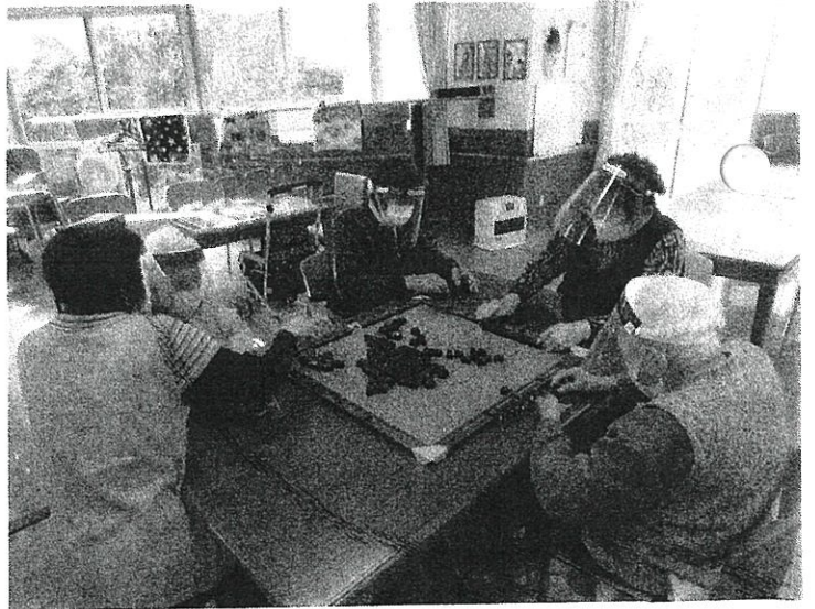
・ゲームの際はマスク・フェイスシールド