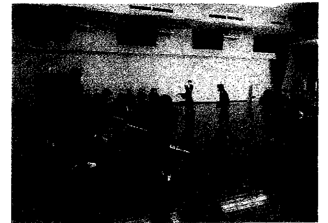
● 輪投げは腕の見せ所??? ! (^ )!