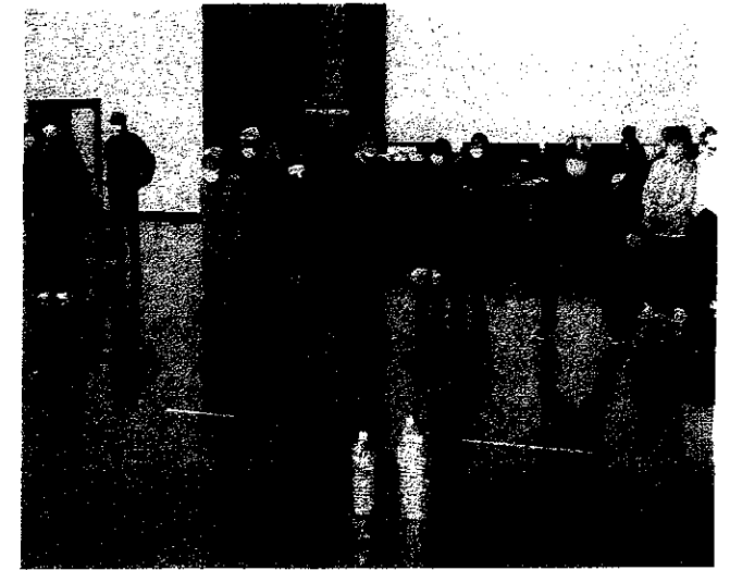
❖ 競技は簡単なんだけど“運と気合い”の勝負です。