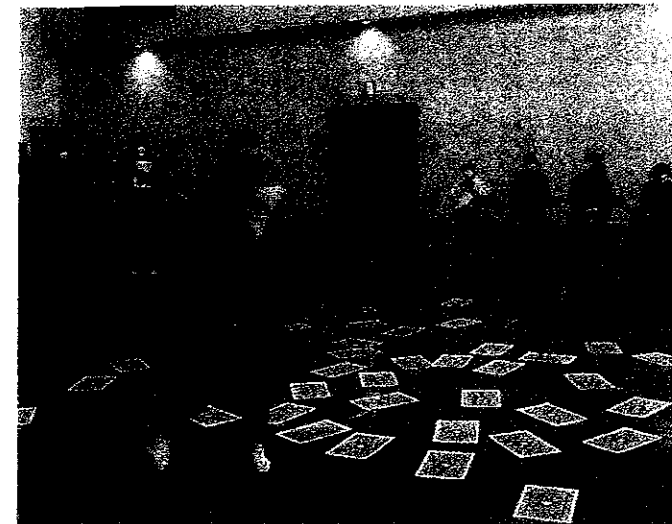
上記写真：ふれあい運動会～

令和4年度での活動で1月・2月に“ふれあい運動会”や“輪投げ大会”を開催することができ(*-*)久しぶりの皆さんの笑顔や歓喜を見聞。活動休止後の3年目で「どれだけの方が来てくださるだろうか？」と不安視していたのが吹き飛びました。(マスク越しでも笑顔が見えて楽しめました。)今年度も皆さんと共に楽しめる様、企画制作していきますのでどうぞご期待下さり、沢山の参加お待ちしております。( _ )-☆