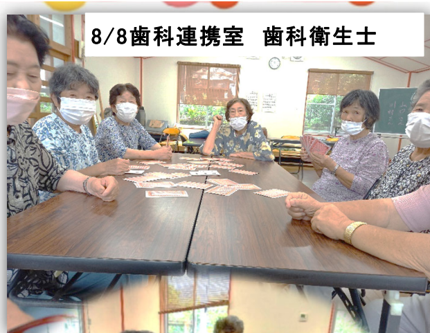
8/8歯科連携室 歯科衛生士