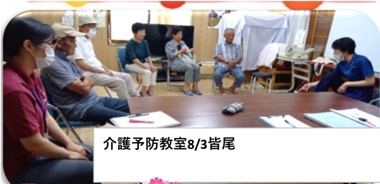
介護予防教室8/3皆尾